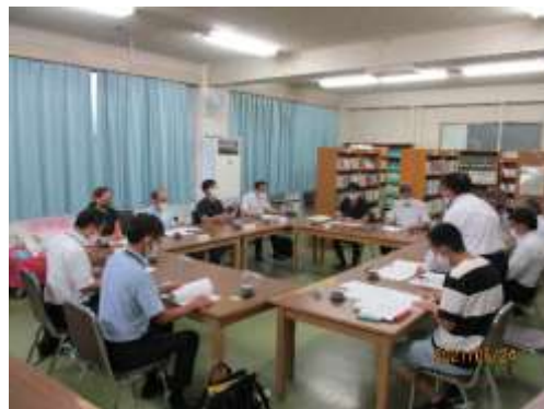
第 1 回学校運営協議会の様子

本校では本校 PTA、前学校評議委員、同窓会、地域住民、学識経験者、行政機関（塩川総合支所）等から委員が選出されています。