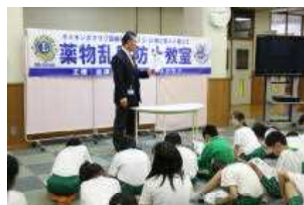
薬物乱用防止教室

5学年の磐梯山登山では、天候が思ったほど回復せず、強風と寒さ、小雨のため、残念ながら途中で登頂をあきらめました。エベレスト登頂を途中で断念したタレントなすびさんと同じように、自然の厳しさ、途中で撤退するための判断力、そして勇気が必要だということを学んだと思います。子どもたちにとっては、非常に貴重な体験になったと思います。改めて、保護者の皆様のご協力に感謝申し上げます。