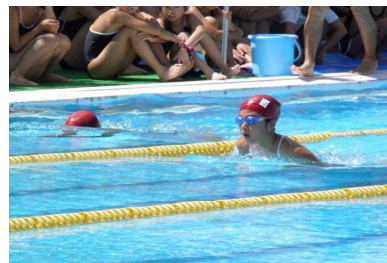
5・6年の校内水泳記録会

応援・ご協力頂きました保護者の皆様に感謝申し上げます。今後もよろしく願いいたします。また、来週の火曜日に行われる祖父母参観には多数の皆様のご参加をお願いいたします。