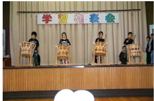
2年生太鼓演奏&amp;劇「フレイメンの音楽隊」