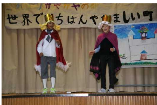
5年生劇「世界でいちばんやかましい町」