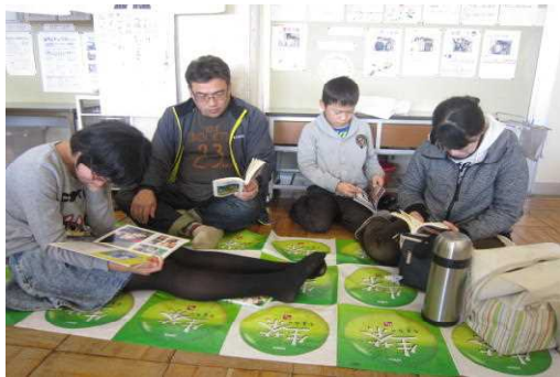
親子読書のひとこま