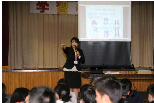
PTA教養委員会「スマホ・ケータイ安全教室」