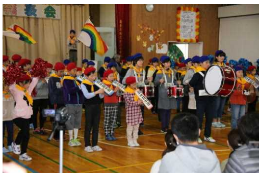
全校生による新曲「RPG」の鼓笛演奏