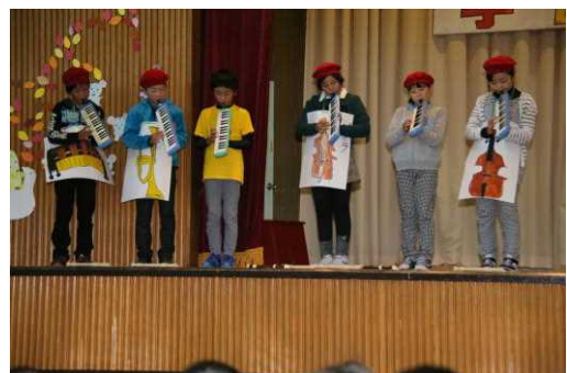
4年生劇「こわれた千の楽器」