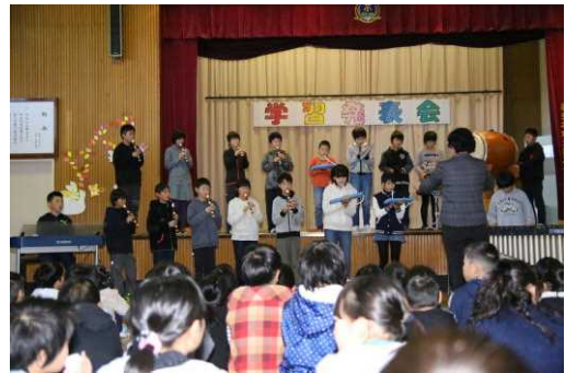
6年生 群読と音楽「心をついに」