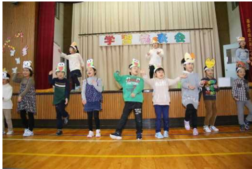
1年生音楽劇「ほくらはみんな生きている」

11月5日(土)に多数のご来賓、保護者、ご家族、岩月・入田付地区の方々においでいただき、学習発表会を開催しました。1年生から6年生及び本年度で閉園となる岩月幼稚園の園児らが、これまで練習してきた音楽や劇を堂々と発表しました。当日は、一人一人が自分の役割をしっかりと自覚し、真剣に取り組む姿が印象的でした。また、小学校・幼稚園の職員も子どもたちの成長を願い、脚本を考えたり構成や動きを工夫したりしながら、指導に努めてきました。子どもたちの力と職員の力が一つになった発表会だと思いますし、これからの学習にも生きるものと確信しています。衣装や小道具の準備等で皆様にご協力いただき本当にありがとうございました。