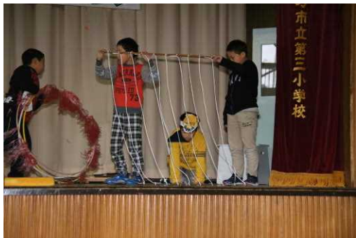
3年生劇「サーカスのライオン」