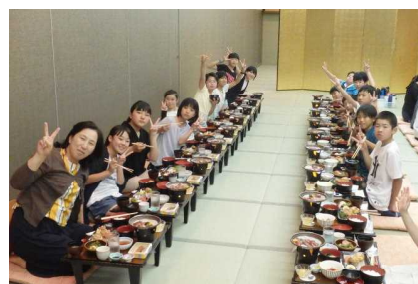
<宿舎での夕ご飯の様子>