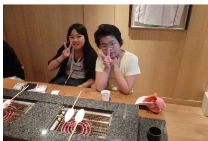
<かまぼこ焼き体験>