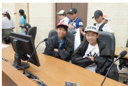
<仙台高等裁判所にて>

1日目は仙台高等裁判所で裁判所の仕事や裁判の仕組みについて勉強した後、仙台市内の班別自主研修、仙台市科学館での見学学習をしました。大観荘に宿泊後の2日目は、五大堂・瑞巖寺見学の後、遊覧船での「語り部クルーズ」、午後からは楽しみにしていたベニーランドの活動と、事故なく楽しい2日間の修学旅行となりました。今回の修学旅行で学んだ協力する大切さや時間を守ることを、集団生活でのルール等をぜひ今後の学校生活に生かしてほしいと思えます。