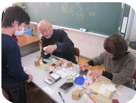
篆刻体験・六年生