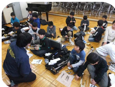
管楽器講習会 四・五年生