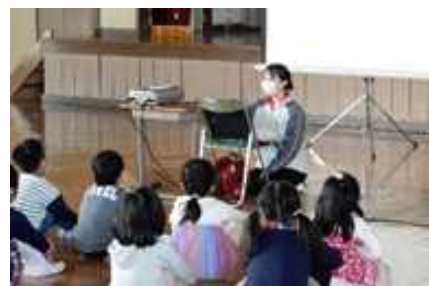
【「密接は?」→「ガヤガヤだ。」】

テレビ等で連日のように報道されているためか、子ども達はいろいろなことを知っていました。情報が多すぎると必要以上に不安な気持ちを引き起こすこともあります。「心配なことがあったら一人で抱え込まずに、周りの人に相談してほしい。」という言葉に、子ども達は真剣な表情でうなずいていました。思いやりをもって、みんなで力を合わせて乗り越えましょう！