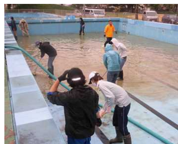
【ドロドロがピカピカに】

17日(日)早朝より、PTA 総務部の皆さんと教職員でプール清掃を行いました。喜多方消防団第一支団第六分団の皆さんのご協力もあり、ドロドロだったプールが見違えるようにきれいになりました。また、校庭のサッカーゴールの移動・設置もお手伝いいただきました。(翌日から、子ども達は大喜びでサッカーをしています。)途中、小雨が降りだす天候の中でしたが、お陰様で短時間で作業を終えることができました。本当にありがとうございました。