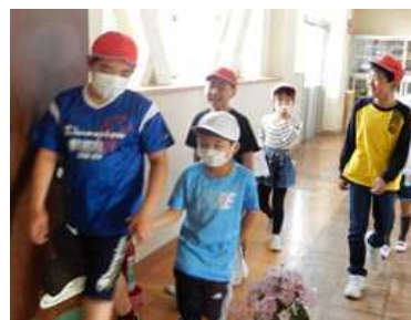
【6年生の案内で体育館へ】

本校では無言清掃に取り組んでいます。子ども達の清掃活動の様子にはとても感心します。昼休みが終わるより先に清掃場所に移動し、無言で並んでいます。床に膝をついて黙々と雑巾がけをするため、膝の汚れは勲章です。縦割り清掃を通して、子ども達に愛校心や社会性を育てていきたいと思えます。