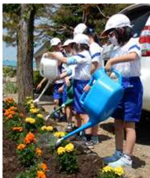
【水やりも心を込めて】

先週は学校花壇にマリーゴールドなどの花苗を植えました。臨時休業中であつたら教職員で行うことになっていた作業ですが、学校再開が早まったおかげで、子ども達の手で行うことができました。