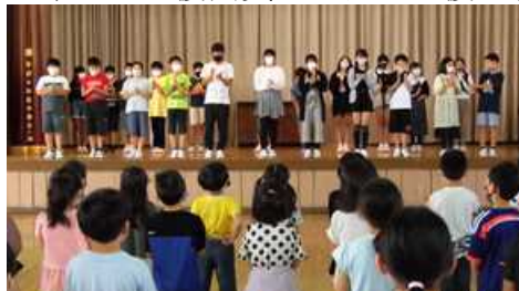
【6年生一人一人から決意表明】

壮行会では、ステージ上で6年生一人一人が意気込みやめあてを発表し、5年生の応援団員の力強い応援に合わせ、1~5年生の子ども達も6年生に心を込めてエールを送りました。