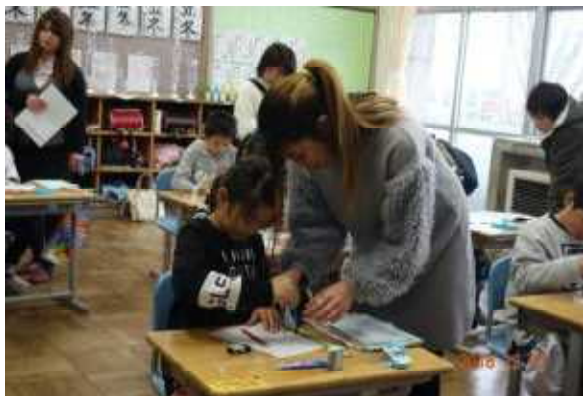
3年算数「まるい形を調べよう」