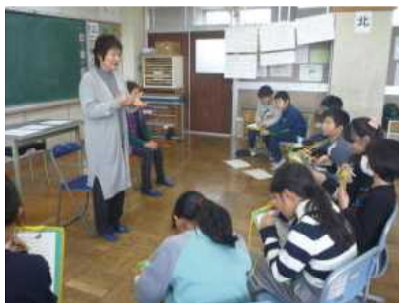
12 / 13 3年社会 (農業科支援員さんをお招きしての学習) * 5年生も行いました。