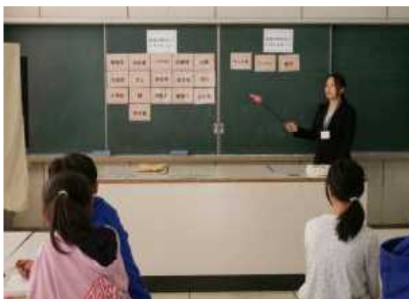
12 / 14 6年租税教室 (市役所税務課の方のお話)