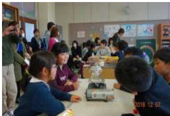
4年理科「水のすがたと温度」