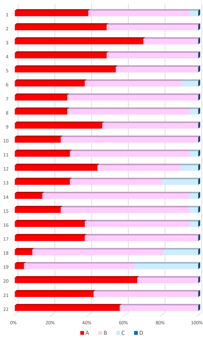
平成30年度 教職員 前期 学校評価アンケート集計結果