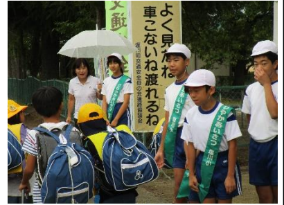
「あいさつ運動」をする児童会運営委員会

4件法で聞いた数値も大切ですが、それ以上に、自由記述の内容を重視しています。それは、子どもが、自由に考え感じていることを「書く」という作業を通して知るものだからです。その結果、得られる情報はかなり高い確率で真実です。