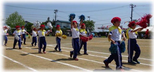
< がんばりますのでご声援をお願いします！ >

※ 学校でベレー帽スカーフ等を身に着けます。スカーフ・手袋はご家庭へ持ち帰らせませうで、洗濯をして12日(月)迄に持たせてください。