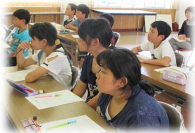
< 真剣に見入る子どもたち >