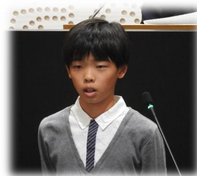
〈 於 本庁舎議場 H29.10.2 〉

今回の子ども議会に参加して、ぼくは議会のやり方が少し分かりました。また、子ども議会には、中学生も出席していて、その中学生の話し方が、声の大きさや間の取り方がとても上手で、どの質問も聞き取りやすかったのに驚きました。質問や答弁の仕方など参考になる所もたくさんあったので、今後の学校生活の話し合い活動の場には是非生かして行きたいと思いました。緊張しましたが、とてもよい経験となりました。ありがとうございました。