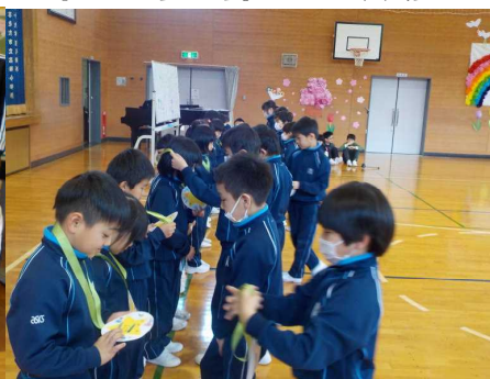
プレゼントを渡す2年生