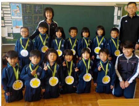
メダルをかけて記念撮影