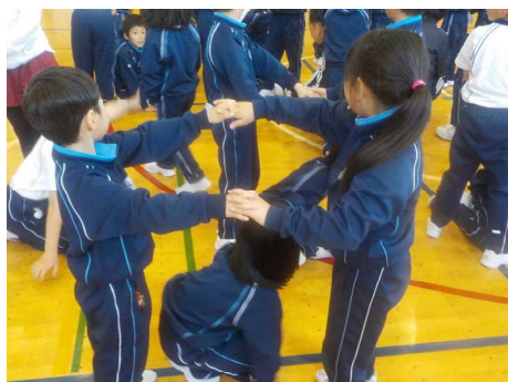
ゲームを楽しむ子ども達