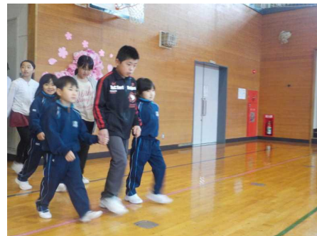
6年生に手を引かれて入場

4月26日(木)体育館で、6年生が中心となって1年生を迎える会を行いました。1年生が喜んでくれるようにゲームなど工夫して準備を進めてきました。6年生として初めて行う児童会行事にとっても積極的に活動する姿が頼もしい限りでした。また、2年生からは入学お祝いのメダルがプレゼントされました。2年生もどんなメダルにするか話し合い「星形のメダルにしよう。」と決めました。心のこもったプレゼント素敵ですね。1年生が、1日も早く小学校生活に慣れて生き生きと活動してくれるように全教職員、全校児童で応援していきます。