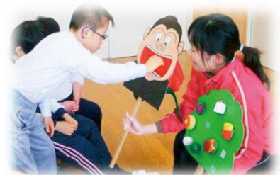
個別の支援を受ける児童

特別支援教育とは、 障がいのある子どもや特別な支援が必要な子ども全てを対象に、一人一人の教育的ニーズに応じた適切な指導及び支援を行い、持てる力を可能な限り伸ばし、生きる力を身に付け、自立して社会に参加できることをめざしています。