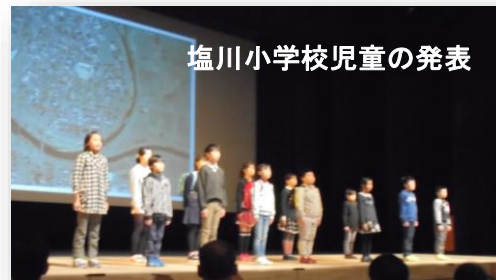
塩川小学校児童の発表

駒形小学校は、農業科で行っている米作りをきっかけに、駒形に流れている「きれいな水」の調査研究をし、一の沢に住む水生生物や水質、そしてきれいな水を残していくために私たちができることを発表しました。