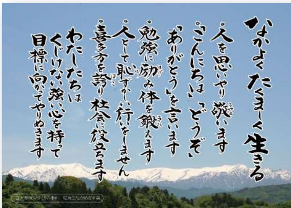
喜多方市人づくりの指針「なかよくたくましく生きる」

問題の克服に向けて取り組むよう、いじめ防止対策推進法（以下、「法」という。）第12条の規定に基づき、いじめの防止等（いじめの防止、いじめの早期発見及びいじめへの対処）のための対策を総合的かつ効果的に推進するための基本的な方針を、「喜多方市いじめ防止基本方針」としてまとめ、ここに策定する。