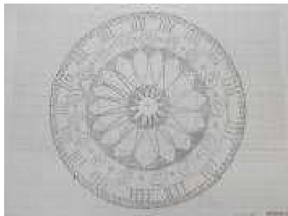
※曼荼羅アート○○○○○さんの作品

2日(火)3日(水)の6校時の美術では「曼荼羅アート」に挑戦しました。1時間目は曲線の習作、2時間目は直線を習作しました。全員集中して作品の制作に取り組み、すばらしい作品を描いていました。