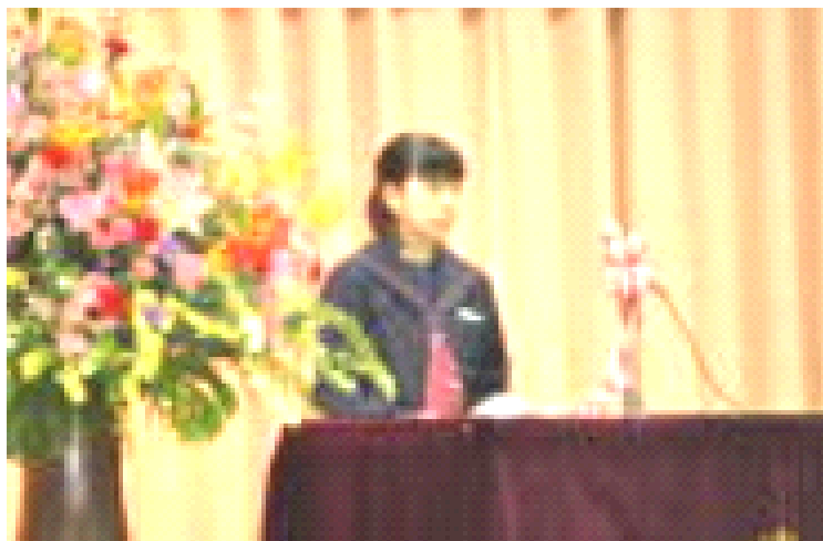
※生徒代表で送辞をよむ○○○○さん