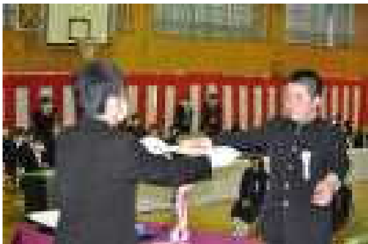
※卒業証書を授与される○○○○さん

今回の卒業式では、2年生の動きが大変素晴らしく、合唱練習、式場準備、後片付けなど、中堅学年として大きな成長を感じることができました。