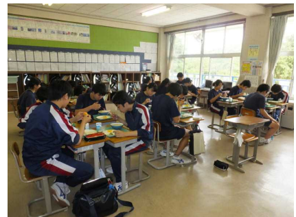
（3年生の給食の様子）