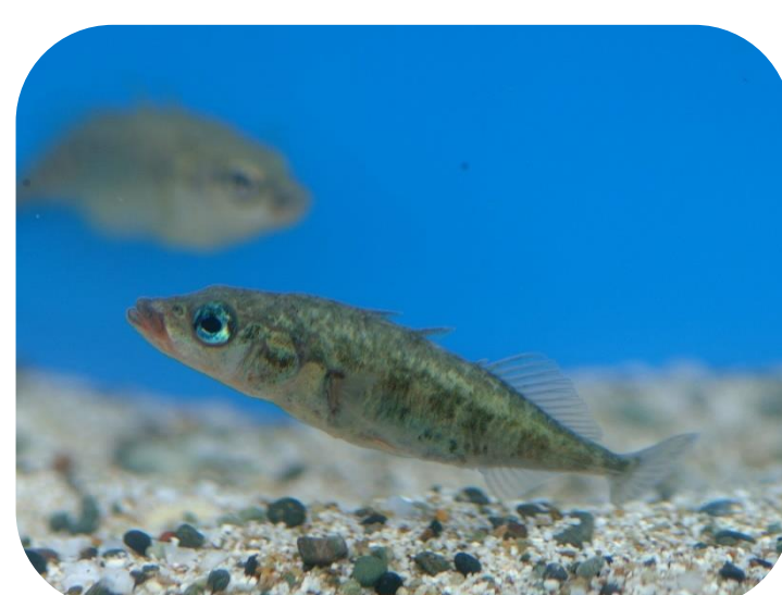
喜多方市の魚 イトヨ