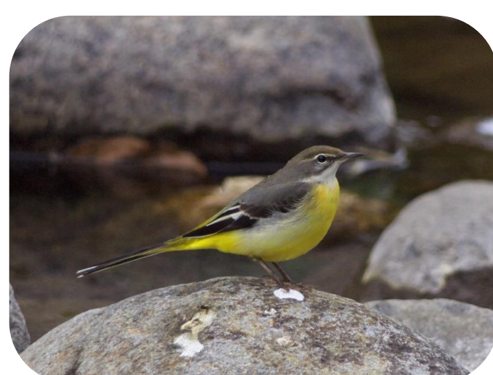
喜多方市の鳥 セキレイ