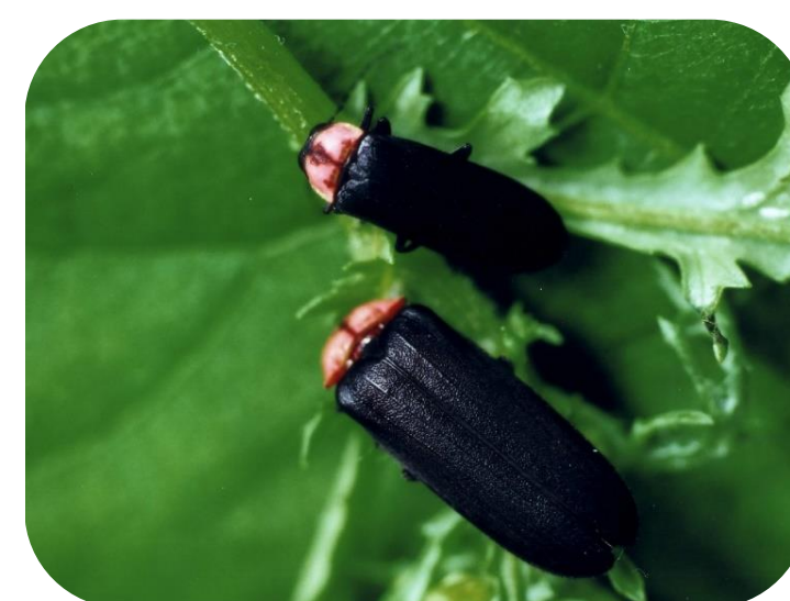
喜多方市の昆虫 ホタル